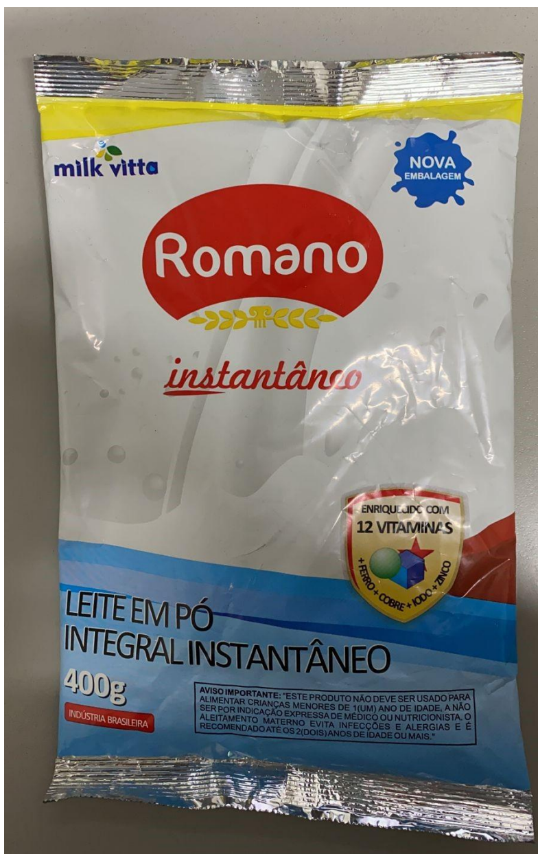
Foto embalagem comprovando não ser do TIPO LATA - Embalagem Leite em Pó – Marca ROMANO:

Item 15 – Desclassificado. Na tabela com a composição dos produtos de cada cesta básica está especificado que o leite integral e instantâneo deve ter embalagem em lata, porém a empresa apresentou amostra em pacote.